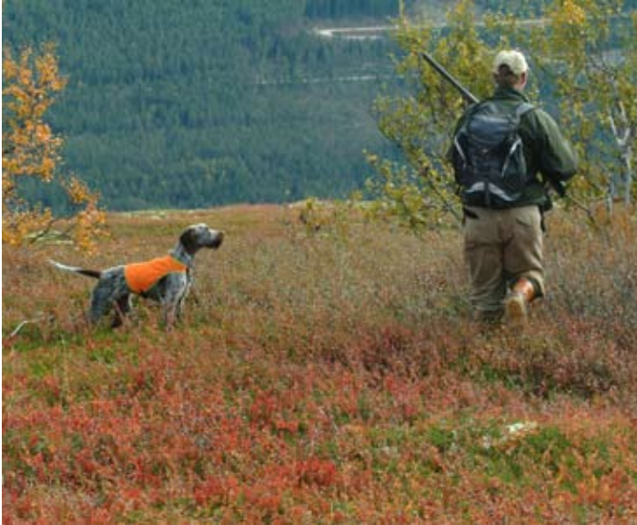
Et spennende øyeblikk. Er det fugl her?

dette. Som ledd i en bærekraftig småviltforvaltning, har FeFo vedtatt å få på plass et mer presist fangstrapporportsystem. En mer presis fangstrapporportering vil gi forvalteren en bedre oversikt over uttak av småvilt samt jakttrykk på Finnmarkseiendommen. Dette vil få stor verdi for videre forvaltning av småviltet på Finnmarkseiendommen.