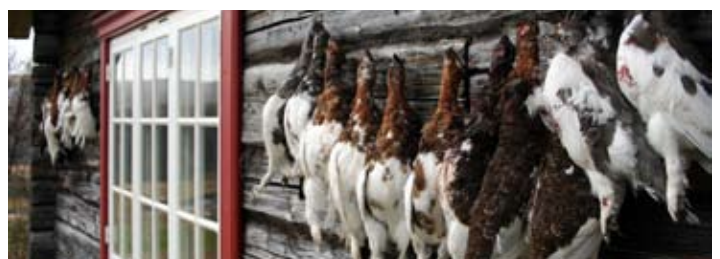
Bra med fugl flere steder i 2007.

Du kan lese mer om konferansen på denne linken: http://welcome.warnercnr.colostate.edu/nrrt/hdfw/