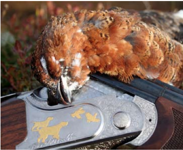
Vakker børse. Vakker fugl.

Dette er det andre nyhetsbrevet fra prosjektet. Vi håper alle har hatt et fint jaktår 07-08, og håper at prosjektet vårt kan bidra med spennende og nyttig informasjon til jegere og andre interesserte!