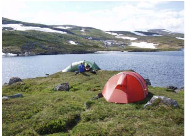
Nyt fjellet i påvente av ny jaks sesong!

Neste nyhetsbrev vil etter planen være tilgjengelig rundt jaktstart i september. Følg med på prosjektets hjemmesider i mellomtiden.